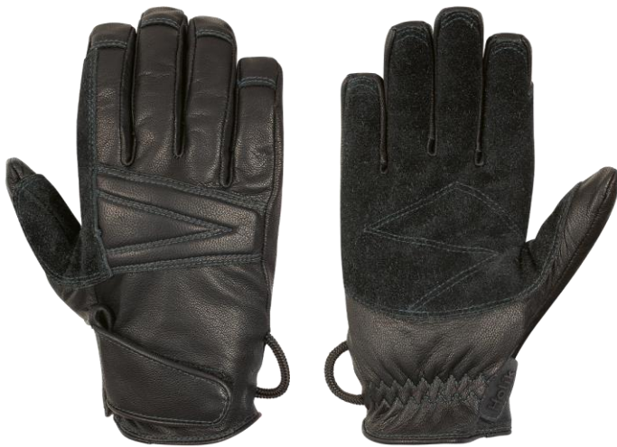
RENCY FAST ROPE Short Black